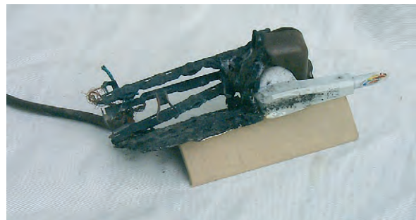
Diese überlastete Tischsteckdose verursachte einen Küchenbrand

Sie müssen zwecks Vermeidung von Wärmestau „offen“ sprich zugänglich betrieben werden, so dass entstehende Wärme abgeführt wird.